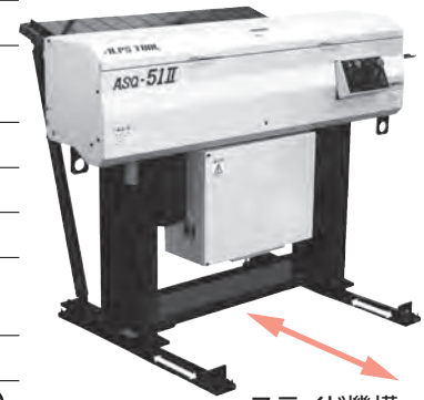
スライド機構 前後に移動